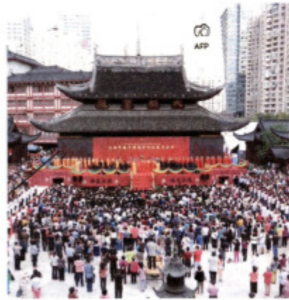
Şanghay'daki tapınağın ana salonu ve heykelleri 30 metre taşındı.