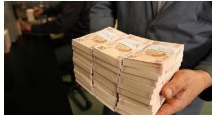
Tecil faizinde de artışa gidildi