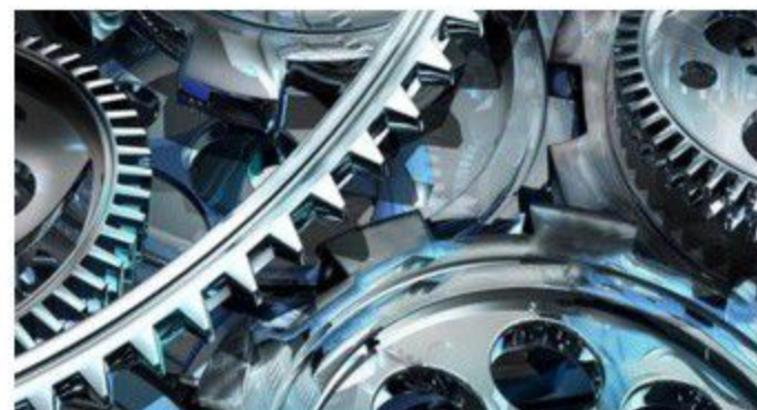
Endüstri 4.0'a küçük projelerle geçin