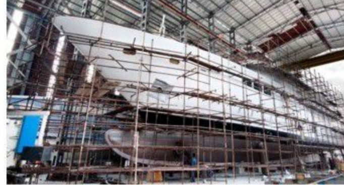
Tersanede 1.5 milyar dolar umudu

Uluslararası Yayıncılar Birliği 2016 verilerine göre, Türkiye'de kişi başına 8.4 kitap düştü. TÜİK verilerine göre, kitap okumak Türk insanının ihtiyaç listesinde 235. sırada. Kitap okumaya ayırdığımız süre günde ortalama sadece 1 dakika. Uluslararası Yayıncılar Birliği verilerine göre, yayın sektörleri arasında Türkiye 11. sırada. Aslında TÜİK verileri basılı kitap sayısının her geçen gün arttığını gösteriyor. Örneğin, elektronik kitap dahil Türkiye'de 2008 yılında 32 bin kitap basılmışken 2014 yılında bu sayı 50 bini aştı. Yani basılı kitap sayısı artıyor ancak kitap okuma oranı yükselmiyor. TÜİK verileri, Türk insanının kitap okumaya sadece 1 dakika ayırdığını gösteriyor. Buna karşılık TV izlemeye ortalama 6 saat, internete bağlanmaya 3 saat ayırıyor. En fazla kitap okuyan ülkelerin başında, yüzde 21 ile Fransa ve İngiltere var. Ardından, yüzde 14 ile Japonya geliyor. ABD'de bu oran yüzde 12, İspanya'da ise, yüzde 9. Türkiye'de ise, oran binde bir. Okuma alışkanlığında, dünyada 86. sıradayız. Kitap okuyanların yüzde 65'i aşk, yüzde 24'ü siyasi, yüzde 13'ü düşünce, yüzde 7'si kişisel gelişim kitapları okuyor. Dünyada kişi başına kitap harcaması 1.3 dolarken, Türkiye'de ise bu rakam 25 sent. Çocuklara kitap hediye edilmesi sıralamasında Türkiye 180 ülke içerisinde 140. sırada.