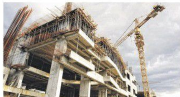
Müteahhitler fiyat farkına 'ayar' istiyor