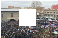
Diyarbakır'da siyonist şer planı telin edildi