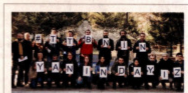
Bakırköy Ruh ve Sinir Hastalıkları Hastanesi'nde destek eylemi yapıldı.