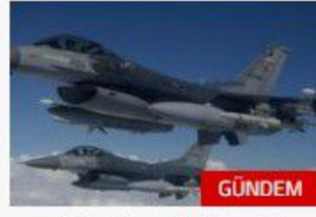
Irak'ın kuzeyinde terör hedefleri vuruldu