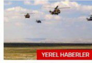
Anadolu Ankası-2018 Tatbikatı sona erdi