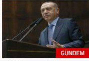
Türkiye yeni bir döneme adım atıyor

VIDEO GALERİ KÖŞE YAZILARI İNFOGRAFIK ANALİZ GÜNDEM EKONOMİ POLİTİKA DÜNYA SPOR SAĞLIK EĞİTİM