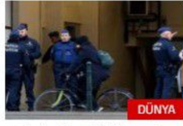
Belçika'da Müslüman kıza saldırıyla ilgili 2 gözaltı