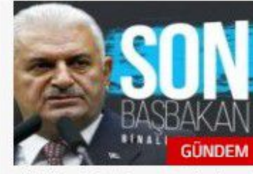
Türkiye'nin 'Son Başbakanı'