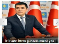
İYİ Parti: İttifak gündemimizde yok