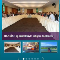
HAKSİAD iş adamlarına istişare toplantısı