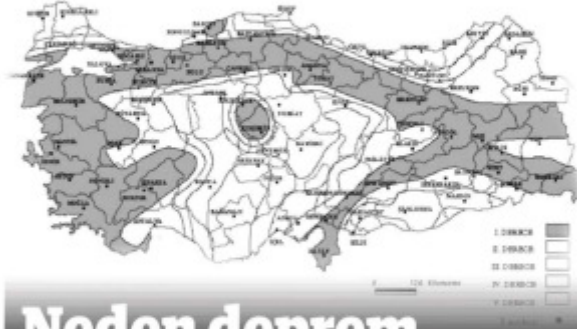
DEPREM BÖLGELERİ HARİTASI*