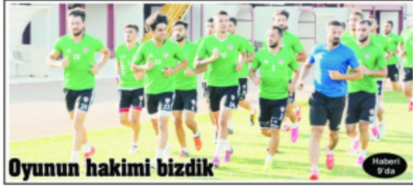
Oyunun hakimi bizdik