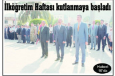
İlköğretim Haftası kutlanmaya başladı