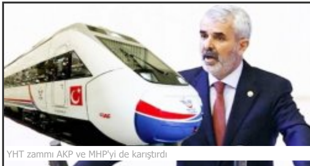
YHT zammı AKP ve MHP'yi de karıştırdı

Araştırmaya katılanların yaklaşık yarısı deprem sigortasının bulunmadığını belirtti. Deprem sigortası yaptıran her 5 kişiden 2'si son 5 sene içerisinde, diğer 3'ü ise 5 yıldan daha uzun süredir sigorta yaptırdıklarını belirtti. Deprem sigortası bulunan katılımcıların yaklaşık yarısı deprem sonrası sigortadan yararlanmak için, geri kalan kesim ise fatura açtırma veya tapu işlemlerini gerçekleştirilme gibi zorunluluklardan bu sigortayı yaptırdıklarını ifade etti.