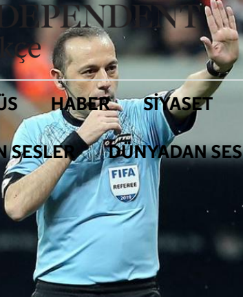
Cüneyt Çakır