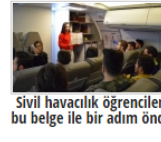
Sivil havacılık öğrencileri bu belge ile bir adım önde