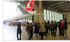
THY Teknik A.Ş İş İlanı başvuru şartları