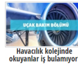
Havacılık kolejinde okuyanlar iş bulamıyor!