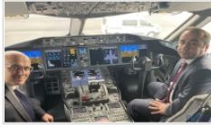
THY Teknik Türkiye'nin yüzü akl