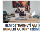
HEM'de "KARNEYİ GETİR BURGERSİ GÖTÜR" etkinliği