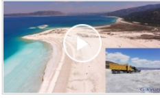
video Saldı Gölü'ndeki son durum!