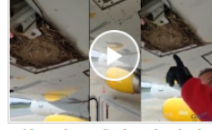
video Yolcu uçağın kanadına kuşlar yuva yaptı