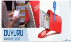
THY Teknik A.Ş çalışanlarına duyuru!