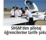
SHGM'den pilotaj öğrencilerine tarife şoku!