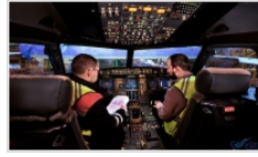
Turkish Technic ailenin bir parçası olmak ister misiniz?