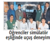
Öğrenciler simülatör eşliğinde uçuş deneyimi