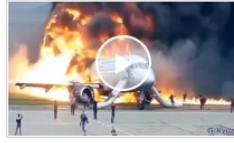
video Uçak kazasının korkunç görüntüleri ortaya çıktı