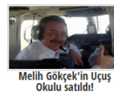
Melih Gökçek'in Uçuş Okulu satıldı!