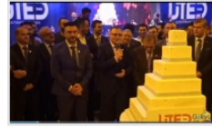
UTED 31. Olağan Genel Kurulu 8 Mart Pazar Günü