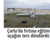
Çorlu'da Fırtına eğitim uçağını ters döndürdü