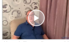
video Katledilen Havalimanı : Atatürk!