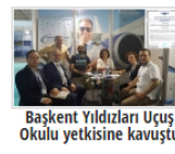
Başkent Yıldızları Uçuş Okulu yetkisine kavuştu