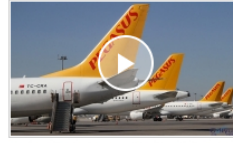
video Pegasus Hava Yolları Mart ayı rakamlarını açıkladı