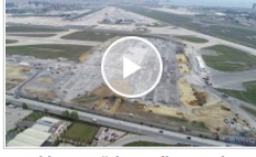
video Atatürk Havalimanı'nda hastanenin temeli ortaya çıktı