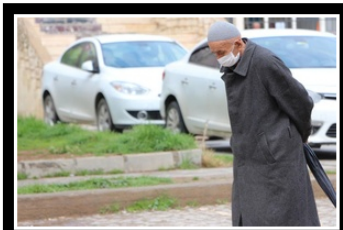
Coronavirus araştırması: Halkın çoğu sokağa çıkma kısıtlaması ilan edilmesinden yana

Türkiye'de ilk vakanın görülmesinden itibaren 30 Nisan 2020 tarihine kadar toplam 1 milyon 33 bin 617 test yapıldı, 120 bin 204 vaka tespit edildi. Bu süreçte 3 bin 174 kişi vefat etti ve 48 bin 886 kişi iyileşti.