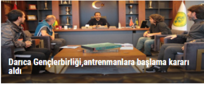
Darca Gençlerbirliđi, antrenmanlara başlama kararı aldı