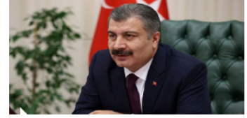
Sağlık Bakanı Koca 65 yaş üstü vatandaşlara teşekkür etti