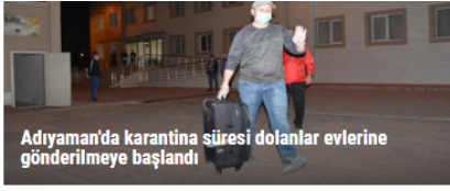
Adıyaman'da karantina süresi dolanlar evlerine gönderilmeye başlandı