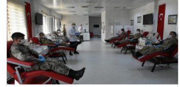
Koronavirüsü yenen 9 jandarma personelinden immün plazma bağıışı