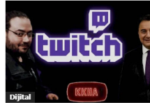
Ali Babacan ve Jahrein 'in Twitch Yayınının Tarihi Belli Oldu