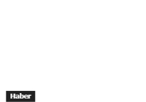
Apple, iPad'lere Yeni Üretkenlik Özellikleri Getiren iPadOS 15 'i Tanıttı