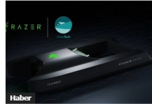
Razer ve ClearBot, Okyanuslardaki Atıkları Yapay Zeka ile Temizliyor