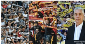
Aman dikkat! Şampiyon olup virüse yenik düşmeyelim