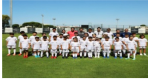
Real Madrid Futbol Okulu 5 Yaşında!