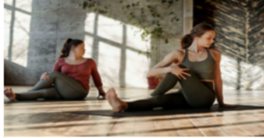
Sağlık için spor, spor için dikkat şart!