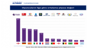
Süper Lig'de bir futbolcunun ortalama değeri...