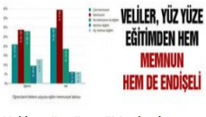
Veliler, yüz yüze eğitimden hem memnun hem de endişeli