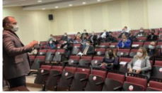
GAÜN'de arşiv yönetimi eğitimi