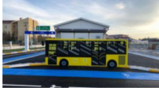
10 ayda yaklaşık 18 bin çocuğa trafik eğitimi verildi