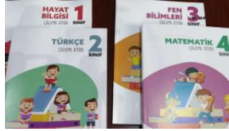
Ders kitapları ve eğitim araçlarının incelenme kriterleri güncellendi