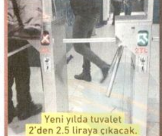
Yeni yılda tuvalet 2'den 2.5 liraya çıkacak.

İstanbul'da umumi tuvalet işletmecileri, TL'nin dolar karşısında değer kaybetmesinin ardından devasa bir şekilde zamlanan tuvalet kağıdı, peçete ve temizlik ürünlerinin maliyetleri altında ezildiklerini belirterek, yılbaşında ücretlere 50 kuruşluk zam yapacaklarını belirtti. İş merkezleri ve iş hanlarındaki umumi tuvaletlerde 1,5 TL olan tuvalet ücreti 2 TL, 2 TL olan yerlerde ise 2 buçuk TL olacak. Tuvalet işletmecileri, bazı vatandaşların fiyatta pazarlık yaptığını ifade etti. Hakkı ALAKAVUK/KORKUSUZ