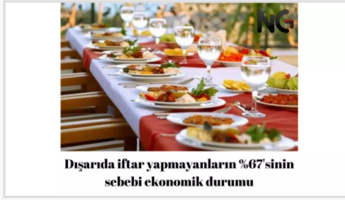
Dışarıda iftar yapmayanların %67'sinin sebebi ekonomik durumu

Katılımcılara dışarda bir mekanda iftar yapıp yapmayacaklarını sorduk. Katılımcıların %44'ü dışarıda iftar yapacağını belirirken, %56'sı ise dışarıda iftar düşünmüyor.