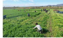
Meryem Kadın Kooperatifi kadının, küçük çiftçinin ve depremzedenin yanında