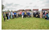
Depremzede ve göçmen kadınlara yönelik çilek hasadı gezisi