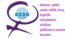
KESK Kadın Meclisi: Emeliğimiz ve Sözümüzle 1 Mayıs'ta Alanlarda, 14 Mayıs'ta Sandık'tayız!