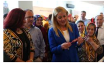
MERKEZFENDİ GİRİŞİMCİ KADINLAR VE EL EMEĞİ FESTİVALİ BAŞLIYOR