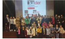
Ka.der Adana Şubesi "Seçim Güvenliğinde Son Durum" Başlıklı Panel Düzenledi